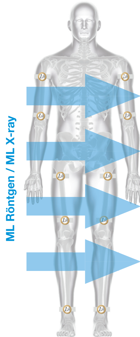
Position der Marker für ML Röntgen-Aufnahme Marker position for X-ray in ML view

Please affix a X-ray marker (example: 1 Euro coin) with adhesive band/tape in the designated positions (frontal and sagittal planes, at the level of the treated bone). Please specify the marker dimensions (example: coin diameter, or inform us which coin is used), so we can calculate the dimensions correctly.